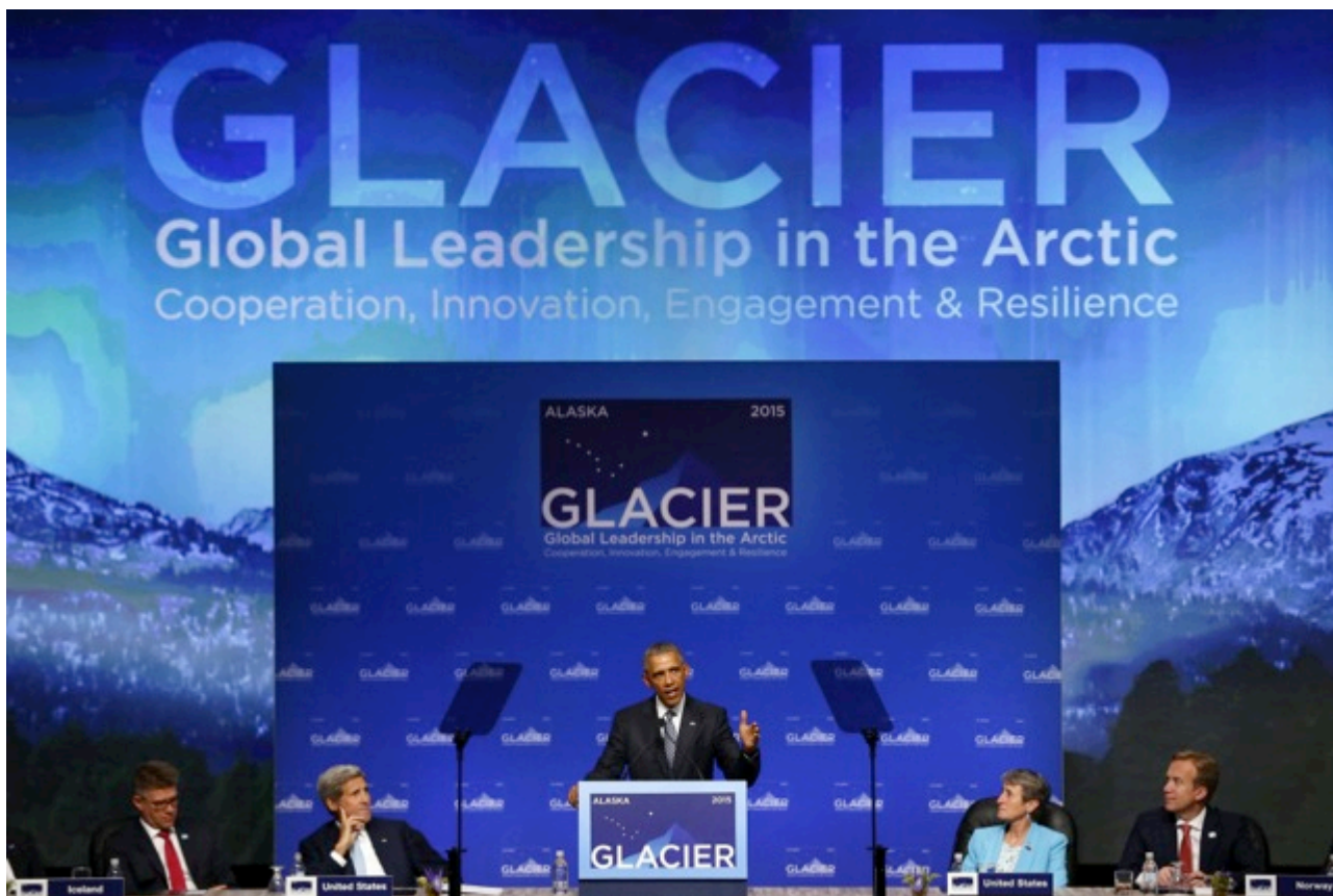
Рисунок 2. Выступление Б. Обамы.

единённые Штаты, конечно, арктическая нация. В этом году мы председательствуем в Арктическом совете. Мы страстно желаем продолжать сотрудничество со всеми арктическими нациями. Сталкиваясь с проблемами, вы должны знать, что мы не можем их решать в одиночку, мы можем решать их только вместе», — заявил Барак Обама 9 .