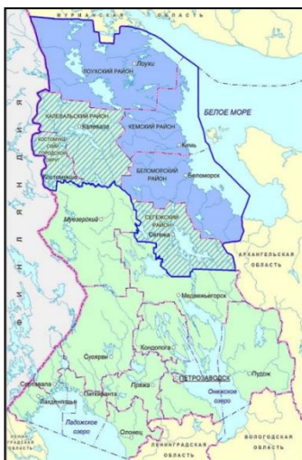
Рис. 1. Муниципалитеты Карельской Арктики 1 .

Карельская Арктика объединяет шесть из 18 муниципалитетов Республики Карелия, выделение которых в состав Арктической зоны РФ происходило постепенно: в 2017 г. — Беломорский, Кемский и Лоухский муниципальные районы (рис. 1., синий цвет), 2020 г. — Костомукшский гор. округ, Сегежский и Калевальский нац. муниципальные районы (штриховка). На западе по территории трёх муниципалитетов проходит государственная российско-финляндская граница, также Карельская Арктика граничит с Мурманской и Архангельской областями, омываясь на северо-востоке водами Белого моря.