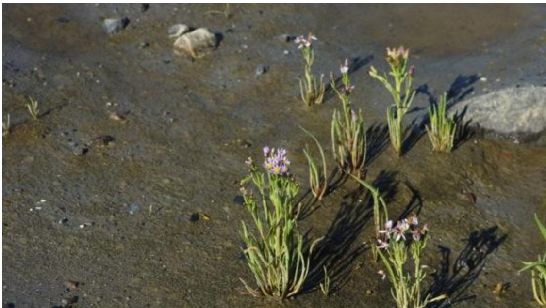
Рис. 1. Астра солончаковая ( Aster tripolium )

L. (рис. 1) — интересна тем, что опыление происходит как под водой (пыльца плавает в ее толще), так и на воздухе, насекомыми. Подорожник морской Plantago maritima L. — многолетник с тонким стеблем и узкими листьями, собранными в прикорневой розетке, соцветие — колос длиной до 50 см.