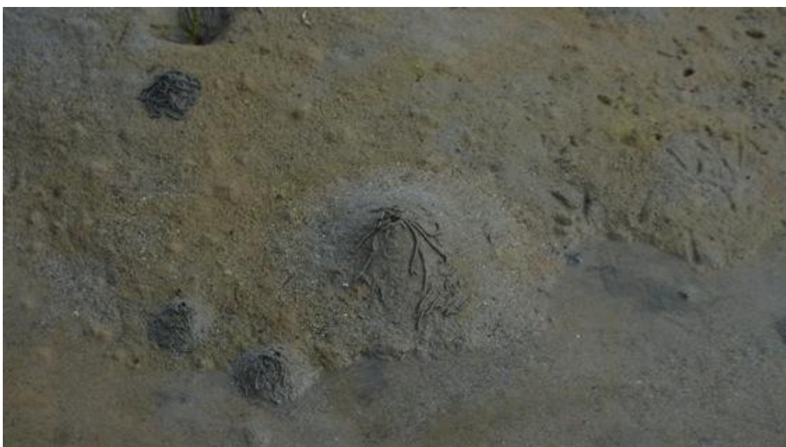
Рис. 2. Морской червь пескожил ( Arenicola marina )

Одно из многочисленных животных литорали — многощетинковый морской червь-пескожил ( Arenicola marina L.), обитающий на глубине до 30 см в песчано-илистых грунтах и образующий поселения разной величины (рис. 2). Когда червь заглатывает грунт, на поверхности отмели возникает углубление — воронка; выброшенные из кишечника длинные шнуры песка со слизью образуют рядом песчаные холмики-конусы правильной формы.