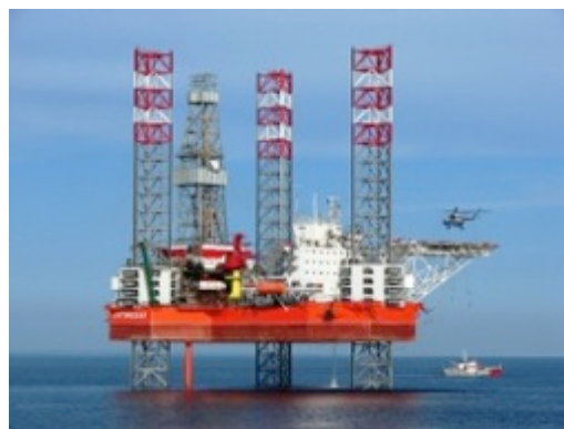
Рисунок 6. Платформа «Арктическая»

Основываясь на анализе ситуации и решая обозначенные задачи, Архангельский регион имеет возможность сформировать промышленный нефтегазовый комплекс СВ «Арктика — шельф», который будет являться активно действующей составной частью Судостроительного инновационного территориального кластера Архангель-