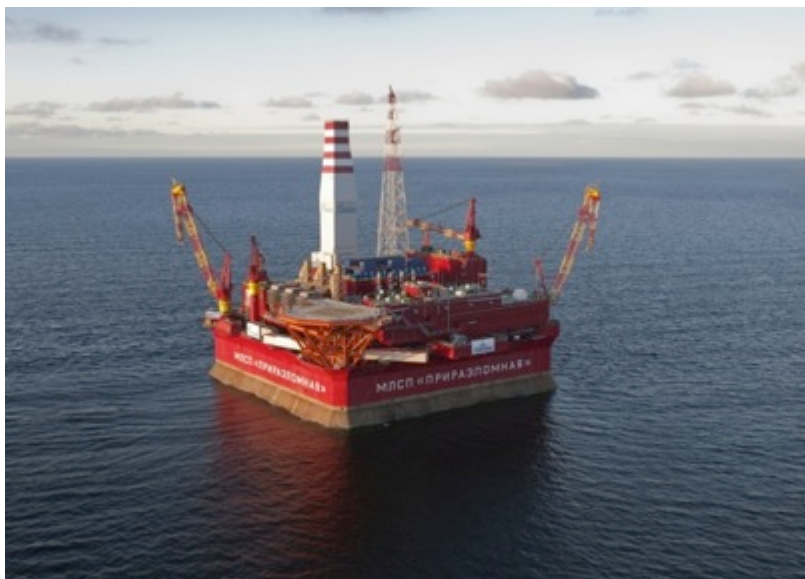
Рис. 5. Платформа «Приразломная»

ном случае возврат утраченных позиций будет стоить титанических усилий, ресурсов и растянется во времени.