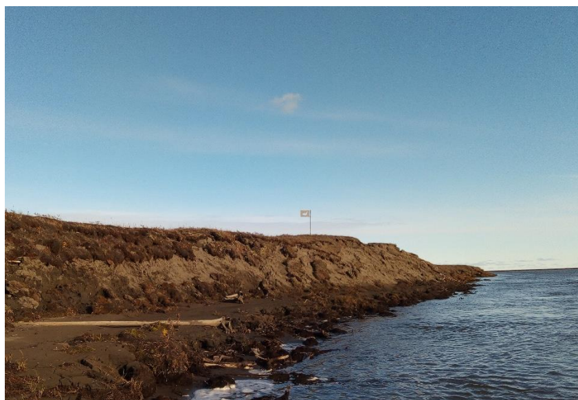
Рис. 4. Урочище Гулянка, отсутствие культурного слоя в разрезе берега, 2022 г.

А.Г. Чикачев записал рассказ русскоустьинской старожилки А.П. Чикачевой-Стрижевой: «Приплыли они на кочах по Голыженской протоке и остановились на устье Елони... и построили 14 домов, кабак и баню. Первое время много пили и гуляли. Несколько человек утонуло. Оттого это место на устье Елони до сих пор называется «Гулянка». Была оспа. Многие умерли. После с Гулянки люди переселились на то место, где теперь Русское Устье стоит» [3, с. 22]. Интересно, что наш информатор П.А. Черемкин относит печальные события на Гулянке к началу XX в. и никак не связывает их с образованием Русского Устья.