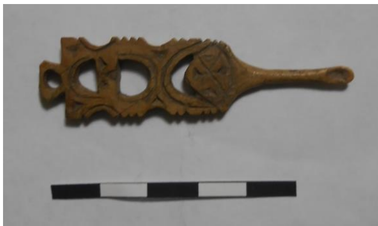
Рис. 3. Копушка из мамонтовой кости, Старое Русское Устье.

Колотушка саблевидной формы для сбивания снега с одежды, головного убора и обуви выполнена из ствола рога северного оленя, разрезанного вдоль пополам. На нижнем конце колотушки присутствуют следы обрезания рога и вырезанное круглое сквозное отверстие для крепления шнура диаметром 0,9 см. Несколько предметов определены местными жителями как детали собачьей упряжи, но никто не мог указать конкретное назначение и место расположения деталей. Из мамонтового бивня изготовлено небольшое, но тяжёлое грузило почти квадратной формы размером 5х6 см.