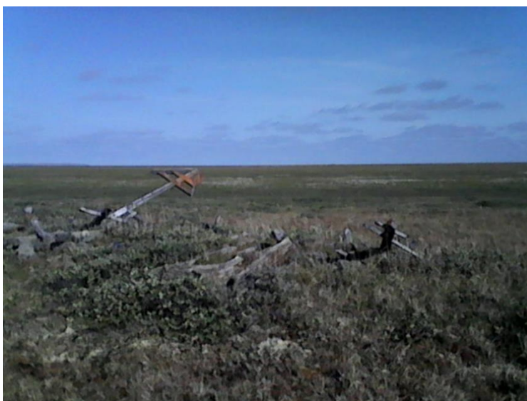
Рис. 1. Заимка Сыроватское на Голыжинской протоке.

Освоение дельты Индигирки русскими промышленниками началось несколько позже её открытия, таможенные документы фиксируют первые отпуска на эту «стороннюю реку» начиная с 1642 г., к середине столетия они становятся массовыми, а к концу века сходят к минимуму из-за упадка пушной добычи и перераспределения миграционных потоков в сторону Дальнего Востока. Карта-схема расположения русских поселений в дельте, составленная краеведом В.И. Шаховой [6], хоть и не очень точна географически, но хорошо демонстрирует освоённость территории. Якуты не расселялись в низовьях Индигирки севернее Бурлугина камня и устья р. Елонь (Берелех), поскольку в тундре отсутствует корм для крупного рогатого скота, это хорошо иллюстрирует топонимика: все названия в дельте абсолютно русские и даже те объекты, что в разное время получили якутские наименования, географическую привязку сохранили русскую — лайда, курья, виска.