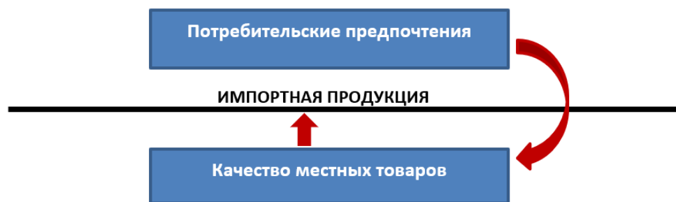
Рис. 3. Схема управления потребительскими предпочтениями.

Следует отметить, что, оказывая влияние на изменение потребительских предпочтений, органы власти через реализуемые ими нормативно-правовые, административные, регуляторные, компенсационные и иные механизмы меняют структуру спроса, которая в свою очередь определяет структуру предложения и в итоге структуру доходов производителей, что в совокупности требует учёта при подготовке стратегических решений, в том числе касающихся продовольственной безопасности и дефицита качественных потребительских товаров [9, Самыгин Д.Ю., с. 63].