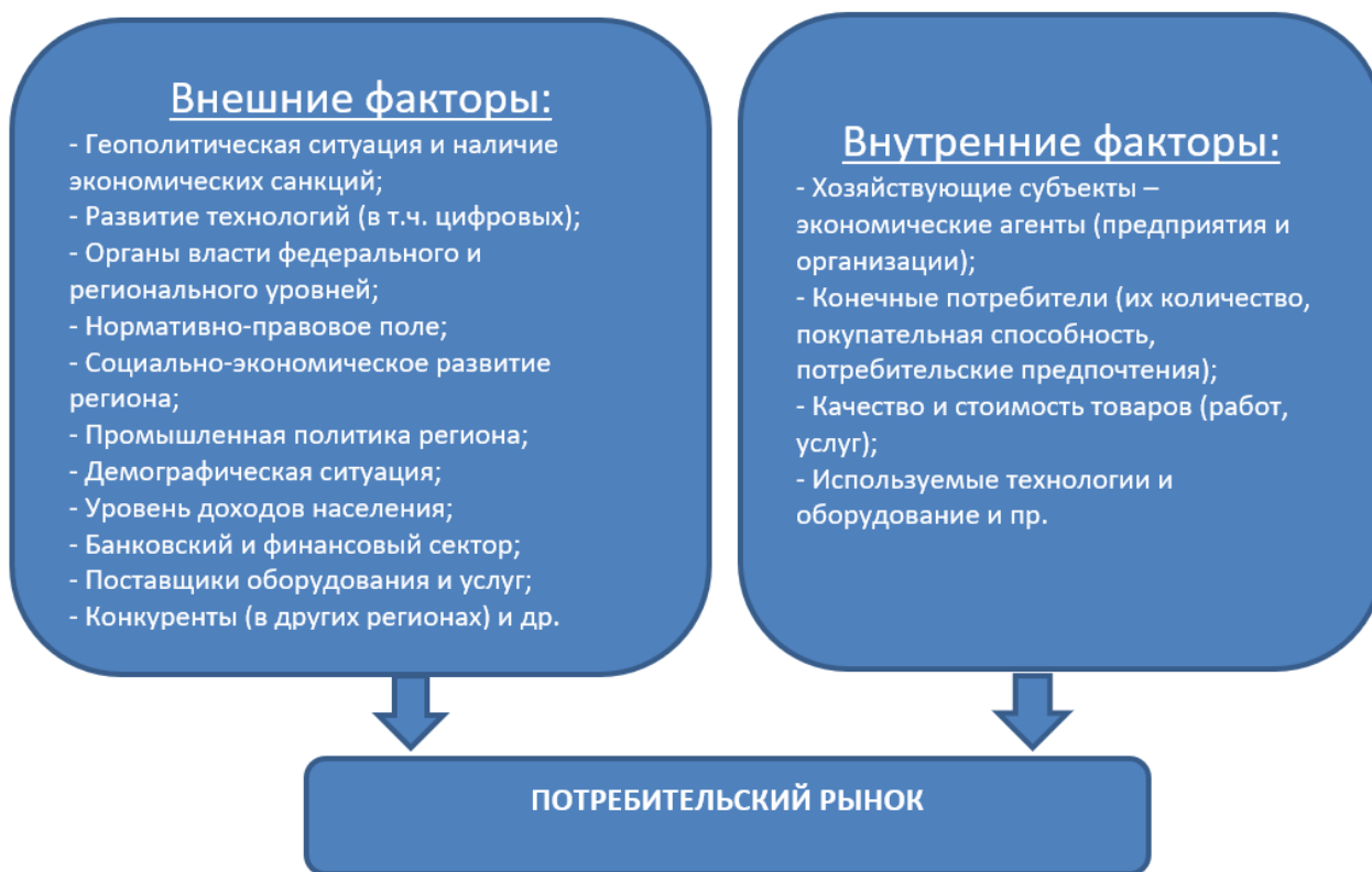
Рис. 1. Система факторов влияния на региональный потребительский рынок.

Потребительский рынок — структура подвижная, чутко реагирующая на любые социально-экономические изменения. Система внутренних и внешних факторов, оказывающих влияние на региональный потребительский рынок, представлена на рис. 1.