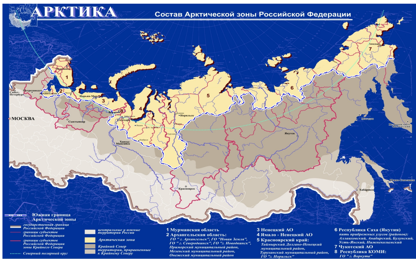
Рисунок 3. Состав АЗРФ в 2014 году / © Цибульский А.В.

Рецензент: Лукин Юрий Федорович, доктор исторических наук, профессор