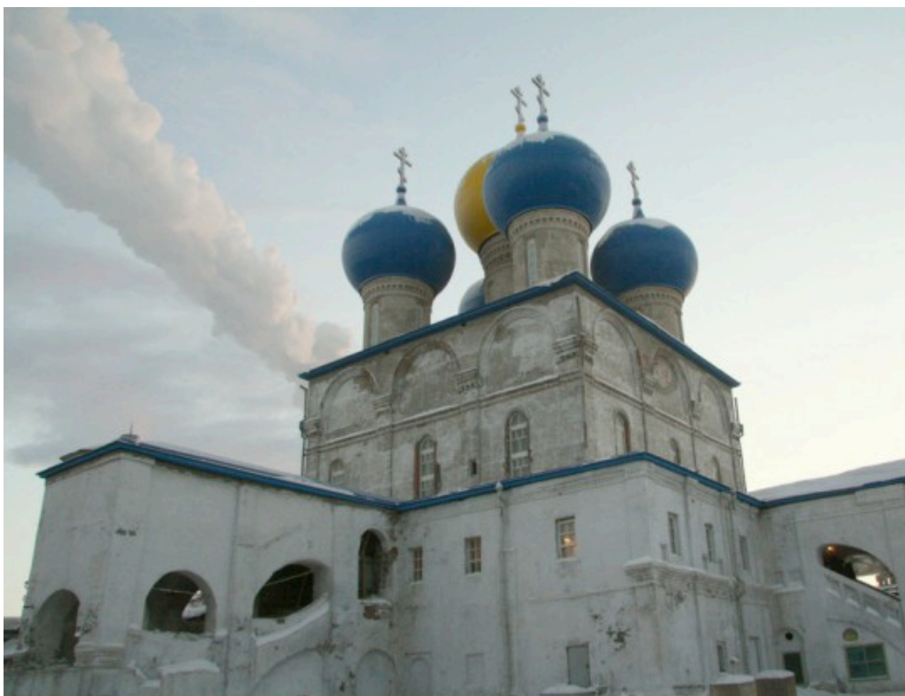
Рисунок 2. 600-летие Николо-Корельского монастыря в Северодвинске.

В среднегодовом исчислении численность трудовых ресурсов Северодвинска составила 120,1 тыс. человек, из них в экономике города занято 93 тыс. человек (49% общей численности постоянного населения). Преобладающая часть занятого населения сосредоточена в крупных организациях и субъектах среднего предпринимательства. Основными отраслями производства являются судостроение и судоремонт, электроэнергетика, производство строительных материалов, пищевая промышленность и др. Комплекс градообразующих предприятий Северодвинска составляют ОАО «ПО «Севмаш», ОАО «ЦС «Звездочка», ОАО «СПО «Арктика», на которых трудится 37 тысяч человек или 40% занятого в экономике населения города 5 . Основу экономики города составляет крупнейший и уникальный судостроительный комплекс страны, где производятся и ремонтируются корабли для Военно-морского флота России.