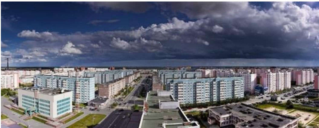
Рисунок 5. Город Новый Уренгой

Рыночный период. Второй период промышленного освоения ресурсов и территорий ЯНАО начался в 1990-х гг. и был связан с изменением политического режима и становлением рыночной экономики.