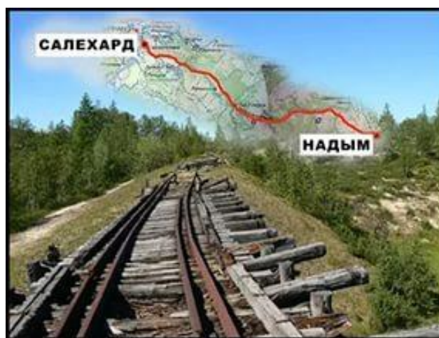
Рисунок 3. Остатки ж/д Салехард – Надым (501 стройка)

зованием спецпереселенцев, без создания крупных индустриальных производств. Заготовка оставалась одним из основных видов деятельности, в то же время развивалась промышленная рыбодобыча и переработка, происходила коллективизация традиционных оленеводческих хозяйств, формировалось сельское хозяйство [11]. Переосмысление геостратегической роли Арктики после Великой Отечественной войны предопределило железнодорожное строительство и попытки создания морских портов как транзитной базы для функционирования Северного морского пути. Стратегия освоения ЯНАО в 20–60-е гг. XX в. получила название комплексного (интегрированного) развития и предусматривала развитие широкого круга отраслей и социальной сферы, не считаясь с затратами на создание (советский комплексный период).