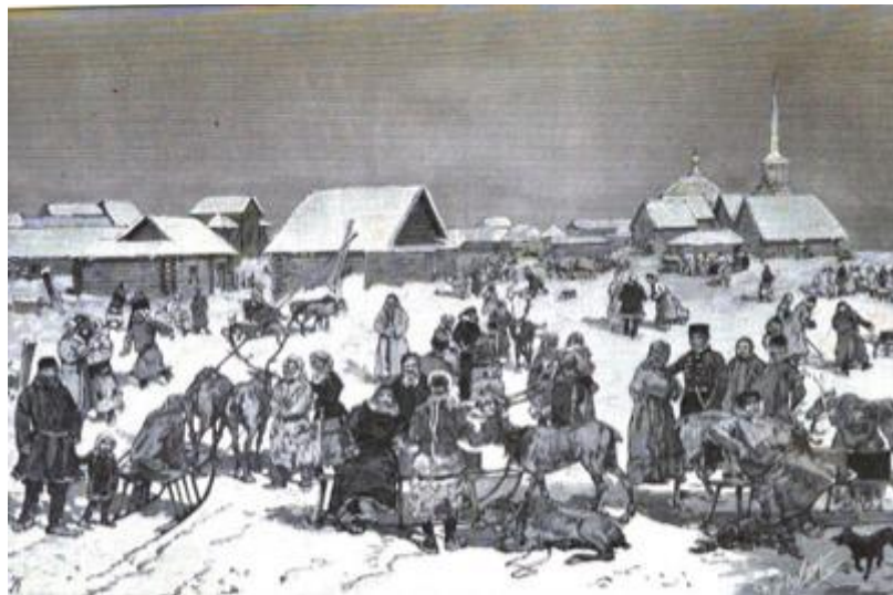
Рисунок 2. Обдорская ярмарка

Обдорский период. Угасание Мангазеи дало начало экономическому развитию Обдорска (создан в 1595 г.), ранее служившего таможенной заставой и перевалочным пунктом. Обдорский период освоения Ямала можно датировать началом XVIII в., когда государство взяло под контроль все меридиальные торговые пути в регионе (морской, чрезкаменные) [10, Мухина Е.В.]. Обдорск стал функционировать в рамках торговли Тобольского разряда, ориентированного на внутрисибирский рынок. Движение товаров изменилось на широтное направление по рекам Обь, Иртыш, Тобол, Тура. Природопользование было полностью традиционным: оленеводство, рыбодобыча, пушной промысел. В XIX в. наблюдается интенсификация освоения региона, включение его в общероссийские процессы модернизации. К началу XX в. из Обдорска ежегодно вывозилось на рынки до 200 тысяч пудов рыбы и около 50 тысяч меховых шкур.