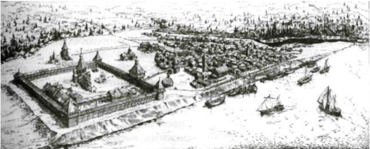
Рисунок 1. Вид Мангазеи. Реконструкция М.И. Белова.

Мангазейский период. До первых десятилетий XX в. территория Сибири, Арктики, в том числе и ЯНАО, осваивалась преимущественно в результате торгово-промысловой колонизации российскими купцами и промышленниками, осуществляющими заготовку пушнины, морского зверя и рыбы, рудоискательскими экспедициями. Мангазейский период начинается с конца XVI в. При этом историки выделяют предшествующие мангазейскому периоду новгородский и московский периоды, однако в настоящей статье они не рассматриваются.