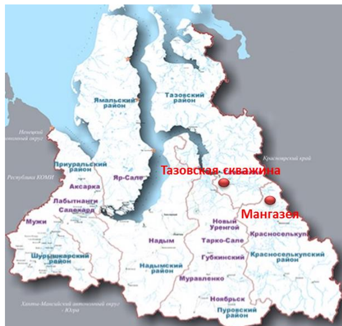
Рисунок 4. Ямало-Ненецкий автономный округ в XXI в.

В процессе постепенного расширения зоны освоения на Север и увеличения затрат на создание городов было предложено ориентироваться на периодическую смену пришлого населения. В результате в 80-х гг. мобильным методом выполнялось более 30% всех работ, количество вахтовиков достигало 130 тыс. человек