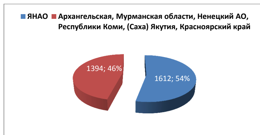
Диаграмма 1. ВРП АЗРФ в 2014 году в млрд. руб. и %

Принято считать, что сформировавшаяся в ЯНАО в 90-е годы модель регионального развития воплощала наиболее удачный пример социально-экономической трансформации добывающего региона в условиях перехода к рынку, позволяла осуществлять комплексное региональное развитие на зрелой экономической и культурной основе [13, Брехунцов А.М., Кулахметов Н.Х.]. Действительно, благодаря созданию на территории Ямала в первый период промышленного освоения развитого топливно-энергетического комплекса (ТЭК), экономический рост в ЯНАО превзошёл все остальные регионы АЗРФ (диагр. 1).