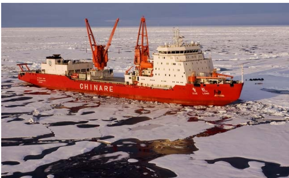
Рис. 5. Китайское исследовательское судно Xue Long 18

дарства должны решать вопросы Арктики, в силу того, что многие неарктические государства, среди них и Китай, будут зависеть от меняющихся условий Арктики. С учетом вышесказанного, понятно, почему китайские аналитики сегодня относятся к своей стране как к «почти арктическому государству» и «заинтересованному в Арктике государству».