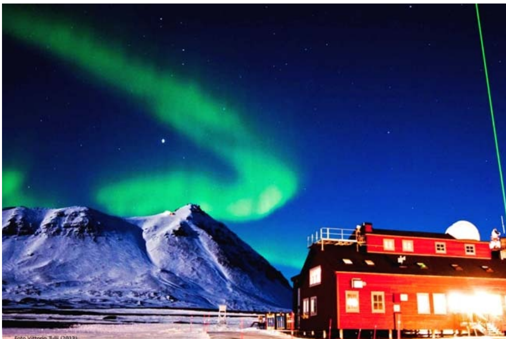
Рис. 4. Итальянская научно-исследовательская станцию Dirigibile Italia на острове Шницберген 14

Кроме этого, представители Италии выступают за расширение прав стран-наблюдателей в Арктическом совете и вовлечение их в принятие решений по проблемам региона, затрагивающих все мировое сообщество.