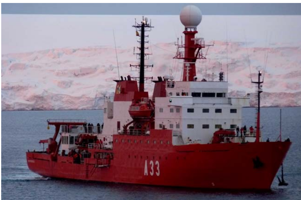
Рис. 3. Исследовательское судно Hesperides 10

Основные вопросы, связанные с научно-исследовательскими программами в Арктике и Антарктике, обобщены на сегодняшний день в рамках Национальной программы исследований при Министерстве науки и инноваций Испании.