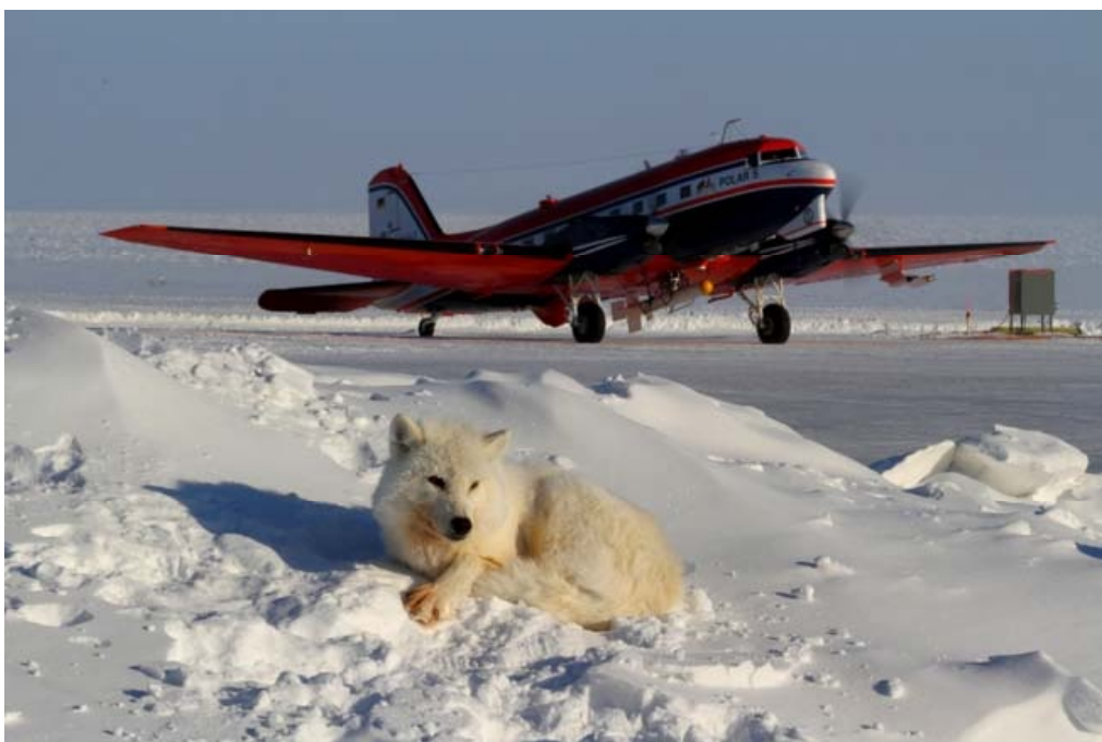
Рис. 1. Самолет Polar 5 на ледовом аэродроме 1

Сейчас у Берлина две постоянные приполярные научно-исследовательские станции — станция «Koldeweey» (совместно с Францией с 1988 г., Шпицберген, Норвегия) и станция «Samoylov» (с 1990-х в южной части Самойловского острова, Россия). Также у немецкого руководства в распоряжении имеется атомный ледокол «Полярная звезда» (Polarstern). Идет строительство второго ледокола «Полярная звезда 2» (Polarstern II). Кроме этого у крупнейшего немецкого Института полярных и морских исследований имени Альфреда Вегенера в распоряжении современные самолеты для полетов в Арктическом и Антарктическом регионах — Polar 5 и Polar 6.