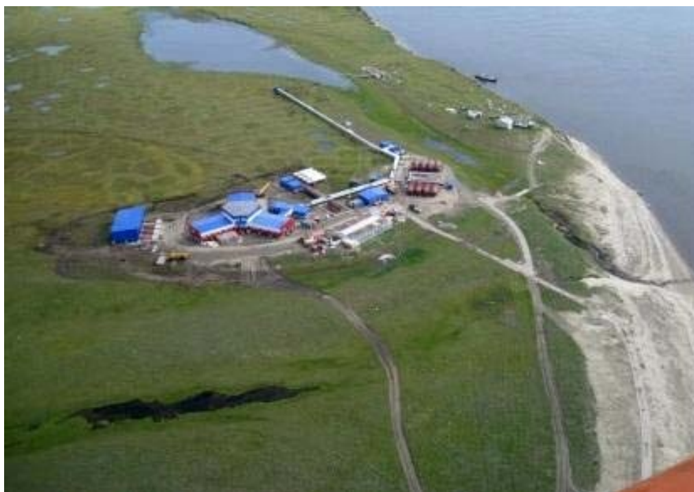
Рис. 2. Научно-исследовательская станция на острове Самойловский 2

В рамках проекта организована программа совместных мониторинговых наблюдений за состоянием Арктики на станциях наблюдений на о. Самойловский (дельта Лены), о. Средний (Чу-па, Белое море) и на озере Темье (район Якутска) с перспективой расширения сети наблюдений в других точках российской Арктики.